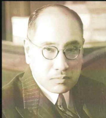
第3代社長 石坂 泰三 1886~1975